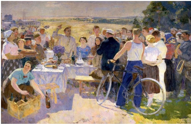
Сергей Герасимов Колхозный праздник . 1937 г.

Очернение советской истории наблюдается давно.