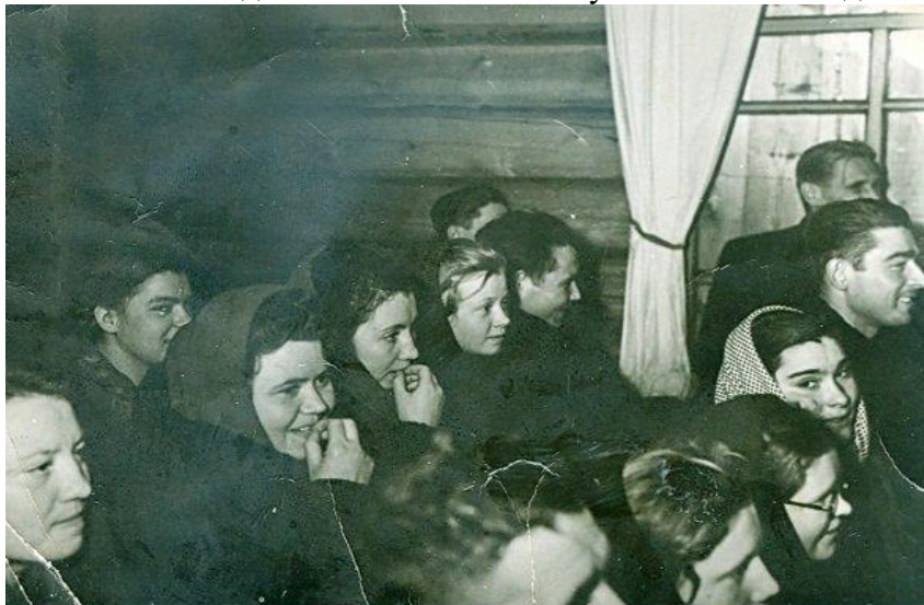
В сельском клубе села Филиппово

Если следовать беловским «канунам» такого не должно было быть – но что-то не